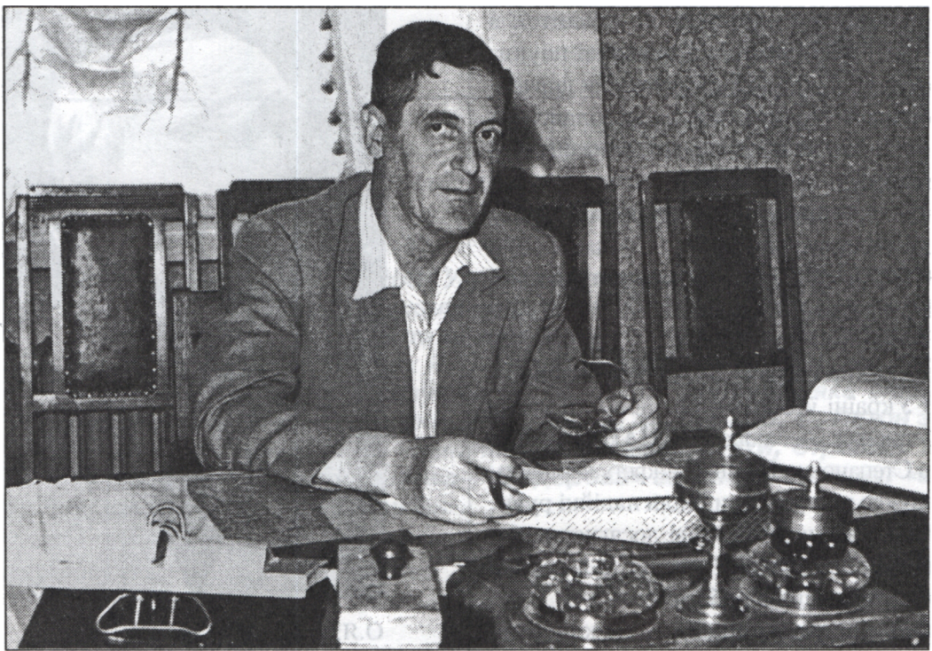
Є.П. Федоров (60-і роки).

Наукова спадщина О.Я. Орлова — велика і різноманітна. Висунуті ним ідеї були новаторськими, а запропоновані методи увійшли в історію як «методи Орлова». Йдеться про «визначення середніх широт», «обчислення координат полюса за спостереженнями на одній станції», «систему Орлова визначення руху полюса — систему середнього полюса епохи спостережень» тощо.